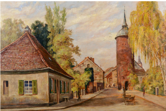
Gemälde von Georg Wehrmann um 1935

Im 19. Jahrhundert wächst die Stadt nur in geringem Maße. Die mittelalterlichen Befestigungsanlagen und das Erscheinungsbild bleiben weitgehend erhalten. Auch im Zweiten Weltkrieg gibt es kaum Zerstörungen.