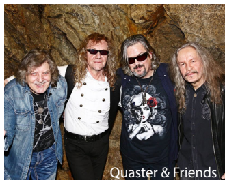
Quaster & Friends